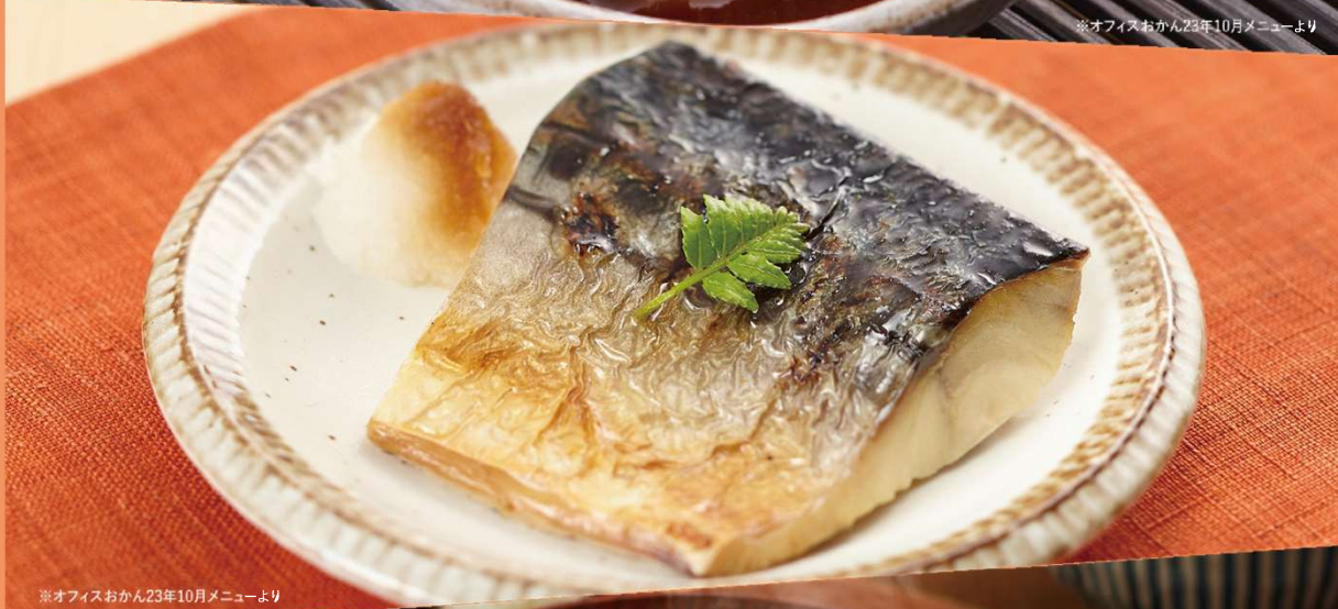
※オフィスおかん23年10月メニューより