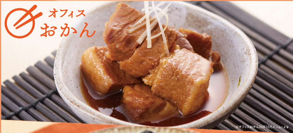
※オフィスおかん23年10月メニューより